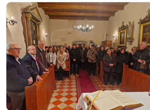
Na Misi u svetoga Andrije