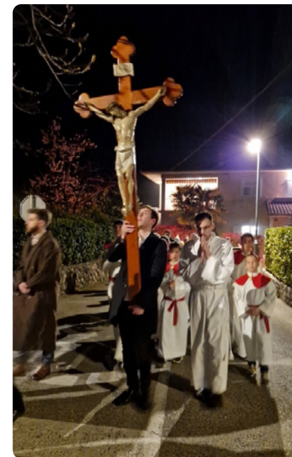
Procesija s križem na Veliki petak